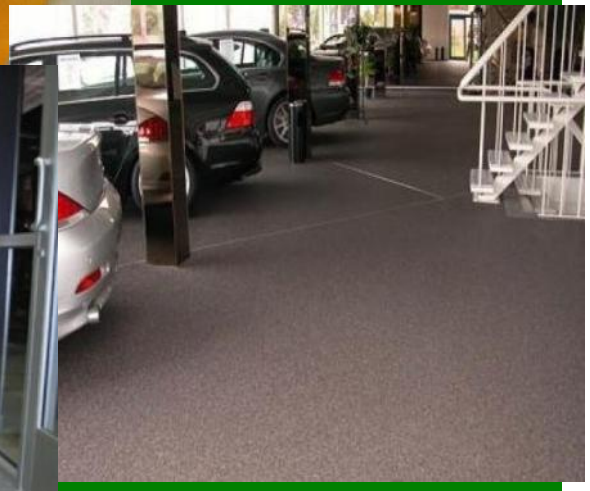
SAMAFLOOR Steinteppiche für dekorative Raumgestaltungen